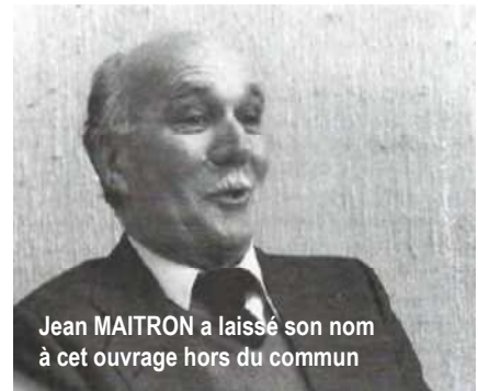
Jean MAITRON a laissé son nom à cet ouvrage hors du commun

Le Maitron, avec ses 216 565 notices biographiques retraçant, en quelques lignes ou plusieurs pages, des moments d'histoire et d'engagements de ces héros du quotidien, est une œuvre monumentale mise au service du mouvement social d'aujourd'hui. Depuis décembre 2018, la quasi-totalité des notices sont accessibles au public, gratuitement, sur le site : https://maitron.fr