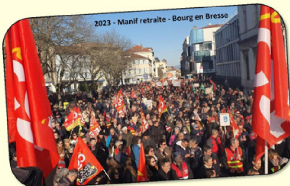
2023 - Manif retraite - Bourg en Bresse

3 Impasse Alfred Chanut 01000 Bourg en Bresse mail : ihsctain@laposte.net tél : 04 74 22 16 48