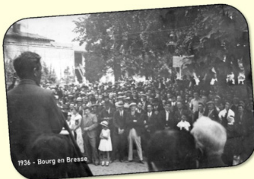
1936 - Bourg en Bresse

Pour collecter la mémoire des travailleuses, des travailleurs et des luttes de l'Ain