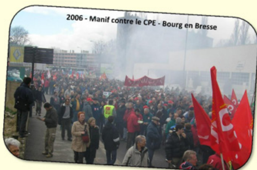
2006 - Manif contre le CPE - Bourg en Bresse