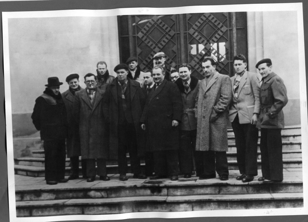
Le C.A. de l'U.D. à BELLEGARDE en 1948.

Dictionnaire biographique des militants CGT du département de l'AIN des origines aux années 2000